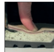
HAIX® MSL System